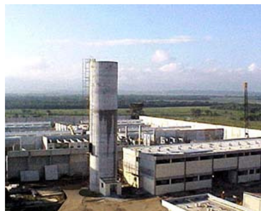
Penitenciária Compacta de Potim, São Paulo. Unidades I e II.