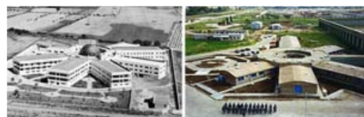
À esquerda, Asilo em Badajoz, Espanha, 1983. Fonte: DIEZ DEL CORRAL, Juan. "Arquitectura y vejez" http://www.coar.es/cultura/elhall/numero72/hastalacocina.htm . À direita, Penitenciária de Buenos Aires. Fonte: Arquivos do DEPEN/MJ. 2001