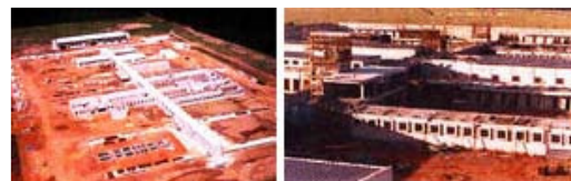
Penitenciárias de Itirapina e Pirajui, Estado de São Paulo.