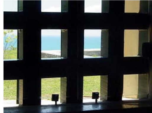
Prisão de Porto Seguro BA.