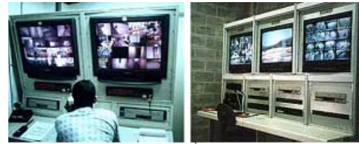
Sistemas eletrônicos de vigilância. À esquerda, Recreio Shopping, Rio de Janeiro. À direita, Penitenciária Dr. Serrano Neves, Presídio Bangu III, Rio de Janeiro.

Adota-se ainda o Modelo Panóptico, idealizado por Bentham em 1800, cujo controle apresentava-se centralizado, podendo observar todos os módulos de vivência. Estes módulos, por sua vez, dispõem-se de maneira radial ou circular para facilitar a visualização do controle. No entanto, esse