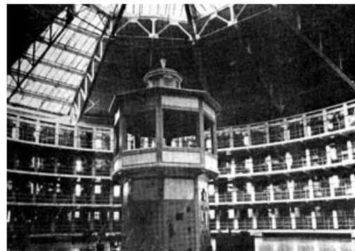
Interior da Penitenciária de Stateville, Estados Unidos, século XX. Fonte: FOUCAULT, Michel. Op. cit.